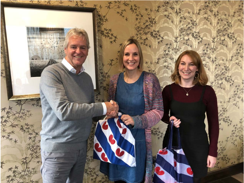
DINGtiid op bezoek in Wales