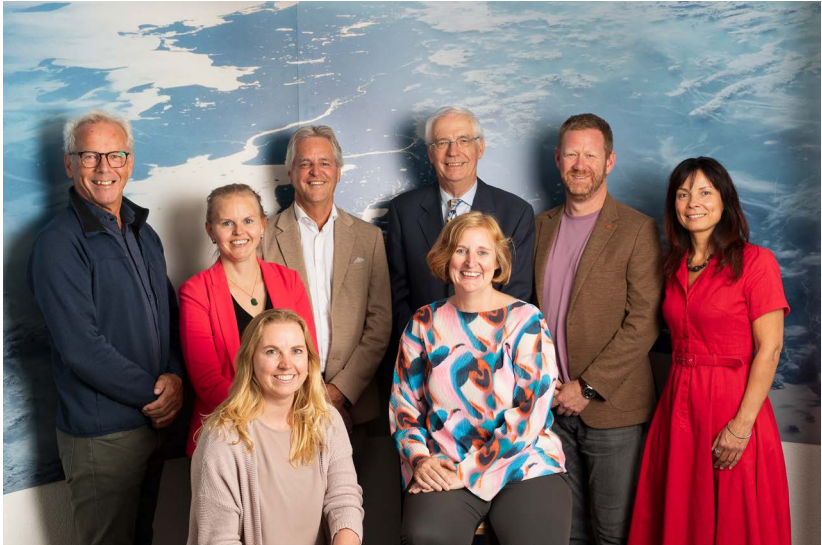
Bestjoer en stêf 2023.