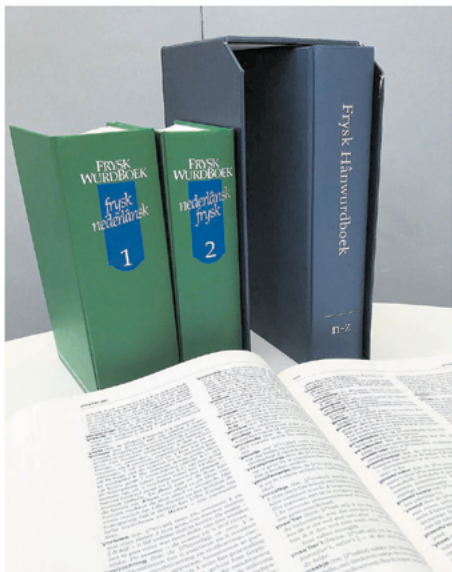
Wit hâlde moar hys en broedje de kolferen te min. Mar ek dy't yn it fild fan de Frysk taal wurdet, wold dat granch ferasje – de jongere koanop dy kân is der ek, mei alle provinsjale analyses mei it Frysk.

DENGid hat koartwei dat de beandliden moarte moar in 'leandliden' koanme om dy gearwiking tal te jaan. Sa in gearwiking fild kin in meandliden agenda opheldje dy't in ome jout kour de beandliden dy't libbe oer it Frysk. Dat is itge wâldich kour de takomst fan in moale taal as de koman – it ûndersyk, en it ûndersyk – hânne derwikkelt. kin it Frysk